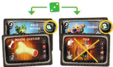
Carte « Moelle osseuse » conservée

Pour les créatures greffées dont le chiffre sur fond vert est strictement inférieur au chiffre du dé vert, c'est le rejet.