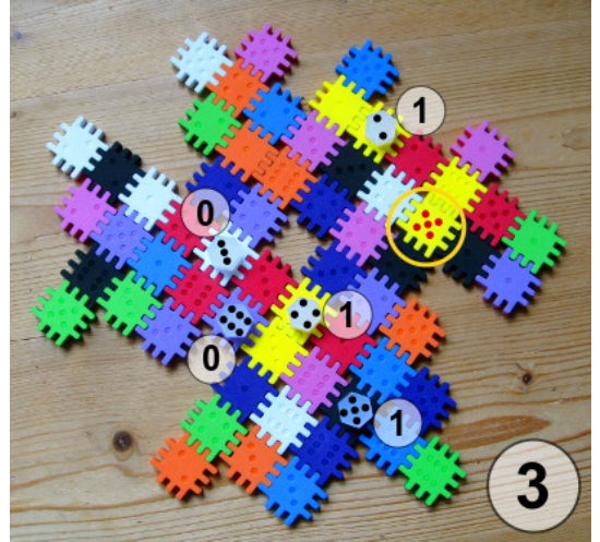
Figure 2 – Le chercheur reçoit une information. Dans cet exemple (Jaune/5), « Trois » : deux pions sont sur une case jaune et un pion est sur une case 5. Un pion placé sur la case à découvrir aurait rapporté deux points.

Le codeur annonce alors au chercheur le total des points gagnés par ses 5 pions (mais pas comment il a gagné ces points). Le chercheur note soigneusement sur un papier ce résultat ainsi que la configuration qui lui a permis de marquer ces points.