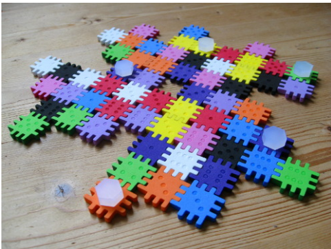
Figure 1 – Placement initial des marqueurs.

Au premier tour, le chercheur entre en scène. Il place ses cinq pions arbitrairement sur cinq cases. Il est possible de placer plusieurs pions sur une même case. En fait, c'est même le but du jeu d'amener les cinq marqueurs à la fin de la manche sur la case où est caché le secret.