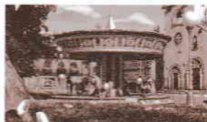
le Village du bois joli