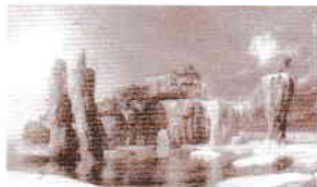
les Glaces éternelles