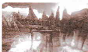
le Volcan maléfique