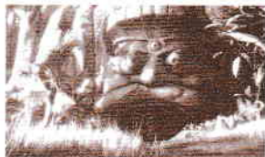
le Temple maudit