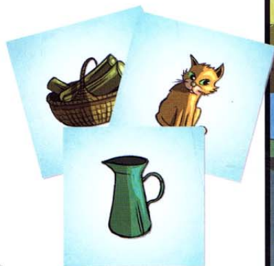
Tuiles « éléments »