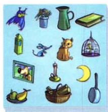
Pioche Tuiles « éléments »

Le plateau « Maison de l'Ogre », le Pion Ogre, 7 bonnets rouges, 7 couronnes d'or jaunes et 14 tuiles « éléments » :