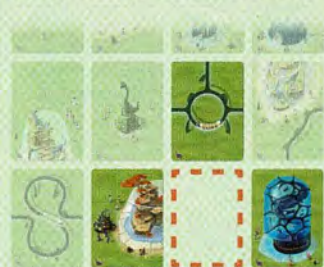
Vous pouvez faire glisser n'importe laquelle de ces cartes vers l'emplacement vide.

Les cartes de votre zoo peuvent être déplacées comme les blocs d'un taquin : en utilisant une seule main , faites glisser une carte vers l'emplacement vide de votre zoo, ce qui va générer un nouvel espace vide. Vous déplacerez ainsi les éléments de votre zoo.