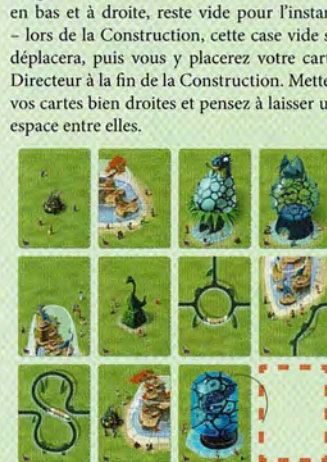
Exemple d'un zoo avant qu'un joueur ne fasse glisser ses cartes

Mélangez vos cartes. Puis, une par une, retournez-les et placez-les face visible afin de former devant vous une grille de 4 x 3. Commencez par la rangée supérieure et dans chaque rangée, commencez par la carte de gauche. La dernière case de votre zoo, en bas et à droite, reste vide pour l'instant – lors de la Construction, cette case vide se déplacera, puis vous y placerez votre carte Directeur à la fin de la Construction. Mettez vos cartes bien droites et pensez à laisser un espace entre elles.