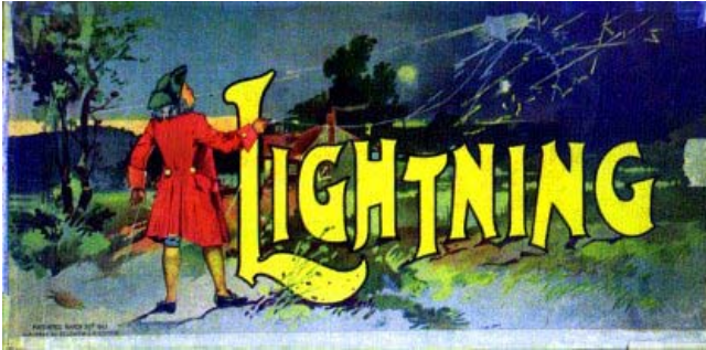
Figure 1 — La boîte de jeu éditée par Selchow & Righter dans les années 1890.