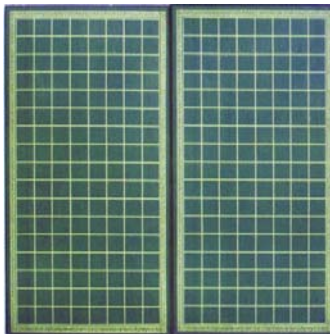
Figure 2 — Le tablier du jeu : les deux camps sont nettement séparés (cliché J. Polczynski).

Les deux joueurs se placent devant le tablier du jeu, chacun est face à son camp. Toutes les pièces sont mélangées et posées sur la table, face cachée, pour former une pioche commune, comme aux dominos.