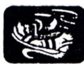
1 carte de déchets non récupérables (fond bleu)