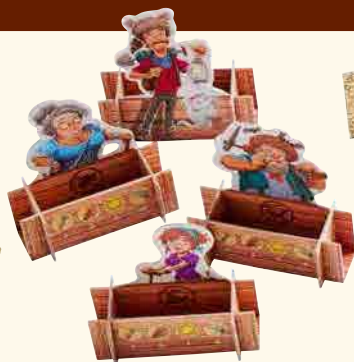
4 personnages avec coffre

(partie inférieure de la boîte avec double fond pour l'effet d'explosion)