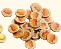
35 pépites d'or illicites