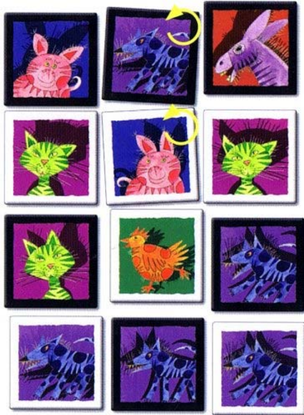
2. Bim Bamm! avec des chiens, si un joueur a une carte « chien »