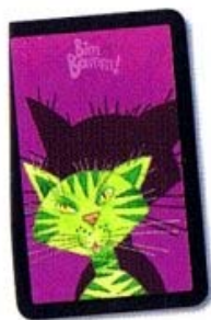
1. Bim Bamm! avec des chats

à chaque fois trois cartes pour le même animal ! Si plusieurs joueurs recherchent la même carte « animaux », le gagnant est celui qui dit BIM BAMB! en premier et pose la carte retournée comme récompense devant lui.