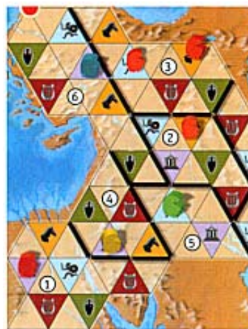
Illustration 6 : Rouge veut collecter des impôts et se défausse d'une carte Hoplite parce que l'un de ses gouverneurs est présent sur une case Hoplite (la province 3).

Les impôts peuvent seulement être collectés une fois par tour du joueur.