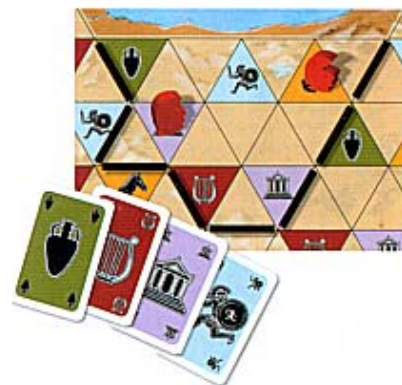
Illustration 4 : Rouge occupe cette province constituée de 9 cases vides et de 6 cases avec symbole en plaçant un de ses gouverneurs sur la case « temple » et un autre sur la case « cheval ». Pour les 4 autres cases de symbole, il se défausse d'une carte correspondante pour chacun (l'Amphore, Hoplite, la Lyre et le Temple).

S'il avait été aussi en possession d'une carte « Cheval » ou d'une carte « Temple », il aurait pu se défausser de l'une d'entre elles au lieu du placement du deuxième gouverneur.