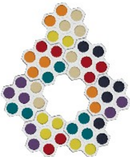
La Grande Croix