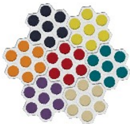
Tablier avec tuiles multicolores