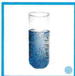
TENEUR EN EAU