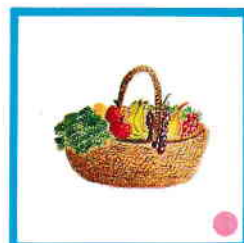
LES 7 FAMILLES