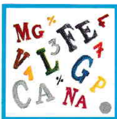
DES CHIFFRES ET DES LETTRES